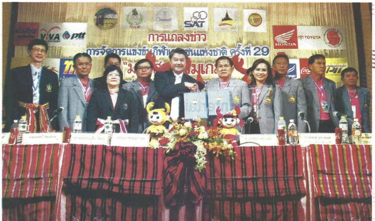
พร้อมแล้วสำหรับ "มหาสารคามเกมส์" เจ้าภาพแดงยืนย่น