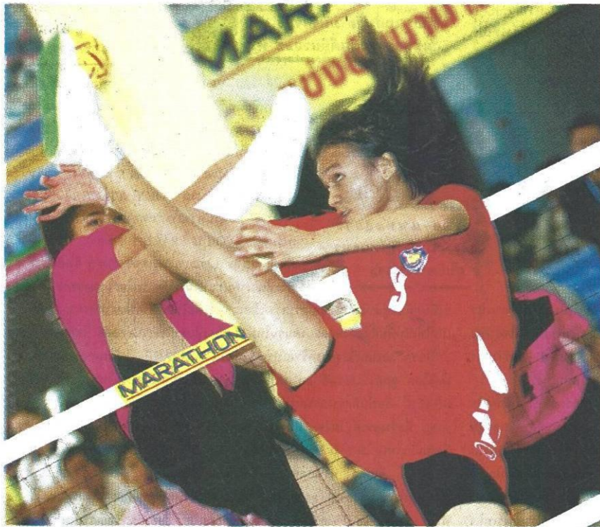
เจกั้นที่ จ.มหาสารคาม ในกีฬาเยาวชนแห่งชาติ ครั้งที่ 29

แห่งหลัก ได้แก่ มหาวิทยาลัยมหาสารคาม สถาบันการพลศึกษามหาสารคาม และมหาวิทยาลัยราชภัฏมหาสารคาม ซึ่งสามารถรองรับนักกีฬาและเจ้าหน้าที่จากทั่วประเทศได้มากกว่า 10,000 คน