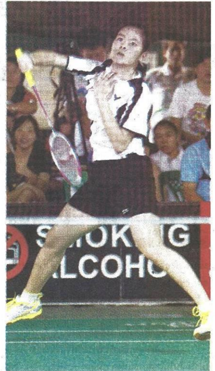
ยกน้ำหนัก และแบดมินตันเป็นอีกกีฬาที่เข้าร่วมชิงชัยใน "มหาสารคามเกมส์" ให้แฟนกีฬาได้ตามเชียร์